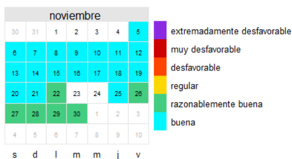
O 3 Noviembre 2021